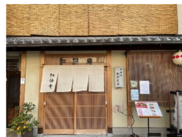
上七軒 おかもと紅梅庵